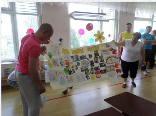
Спортивный праздник при участии родителей «День защиты детей»