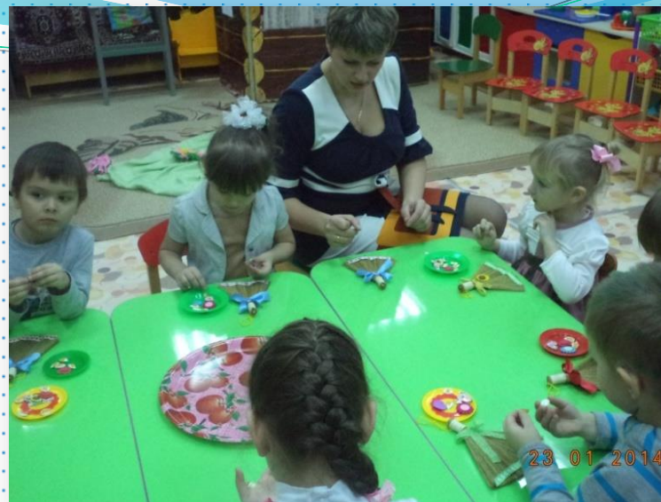
НОД в средней группе по познавательному развитию на тему «Моя дружная семья»