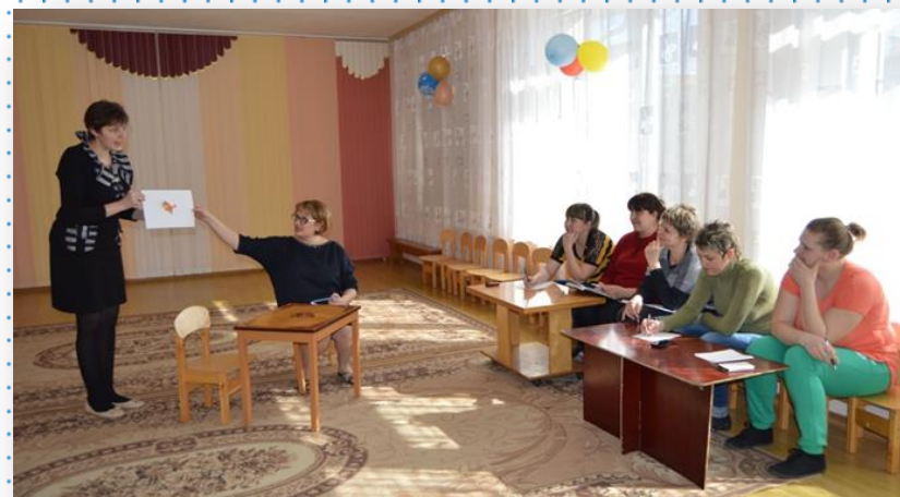
Педагогический кейс «Решение педагогических ситуаций»