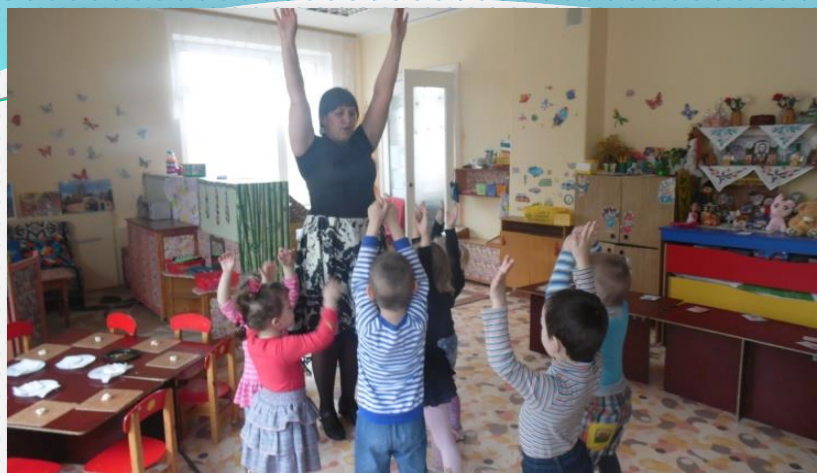
Открытый показ совместной деятельности по познавательному развитию с детьми второй младшей группы на тему «Путешествие по сказке Колобок» с использованием современных технологий