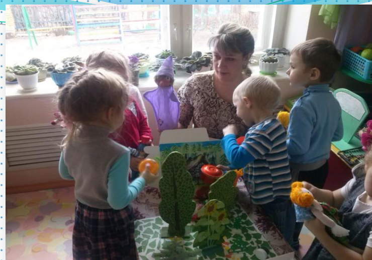
Открытый показ совместной игровой деятельности с детьми в средней группе на тему «Приключения Огонька и его друзей» по мотивам русской народной сказки «Гуси – лебеди»