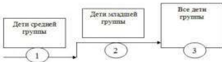
СХЕМА ПРОВЕДЕНИЯ ЗАНЯТИЯ С ПОЭТАПНЫМ НАЧАЛОМ.